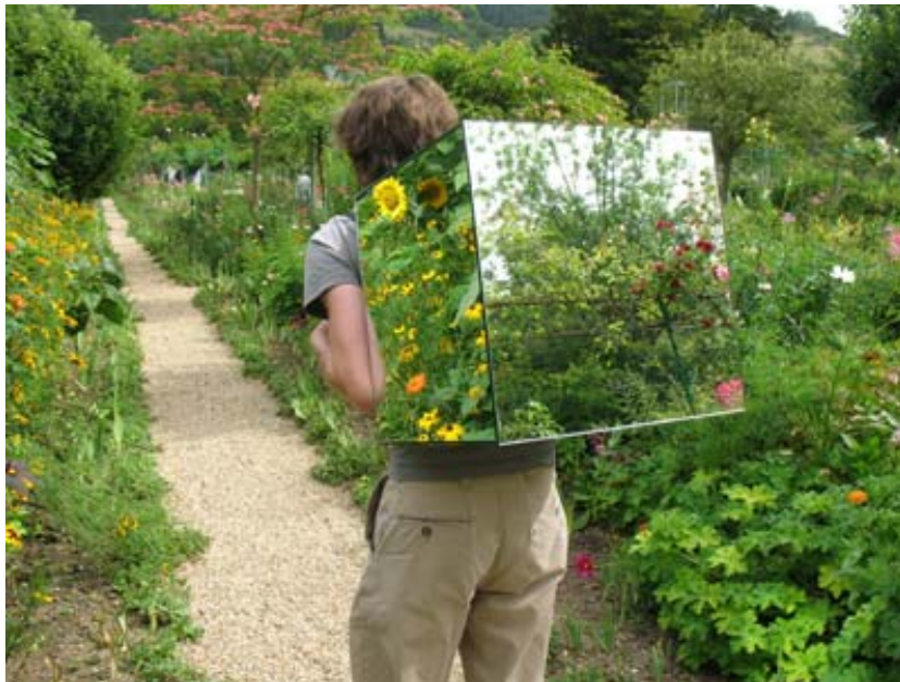
Guillaume Viaud Walking Piece , 2008 Extrait d'un ensemble de 8 photographies accompagnées d'un sac à dos de miroirs 46 x 61 x 2,5 cm Collection FRAC Limousin / © G. Viaud

Centre culturel Jean-Pierre-Fabrègue 6 avenue du Maréchal-de-Lattre-de-Tassigny Saint-Yrieix-La-Perche