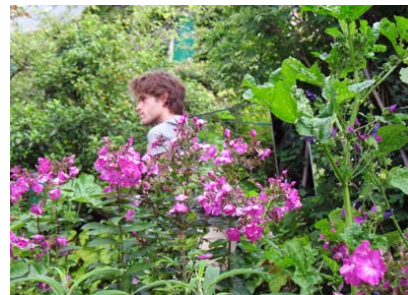
Guillaume Viaud Walking Piece , 2008 Extraits d'un ensemble de 8 photographies accompagnées d'un sac à dos de miroirs, 46 x 61 x 2,5 cm Collection FRAC Limousin / ©G. Viaud

Arpenter, remesurer et se confronter physiquement au réel avec des outils simples, parfois archaïques, telles sont les voies empruntées par Guillaume Viaud pour creuser l'espace et y redécouvrir de nouveaux points de fuite. Comme il l'annonce lui-même, « la sortie est au fond de l'espace ».