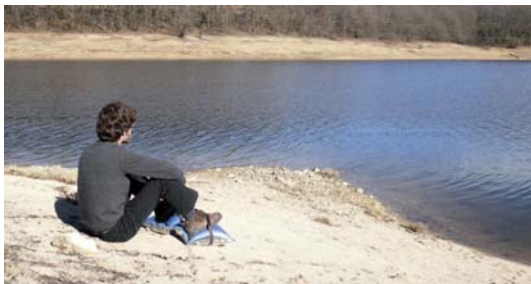
Guillaume Viaud Dead zone , 2009 Tirage numérique, 47,85 x 73,29 cm

Le jeune artiste s'interroge sur les limites du monde et de sa représentation. La série des mètres rubans articulés démontre, sous formes de reliefs, son intérêt pour la relativité de la mesure présentée ici sous forme de ligne brisée, comme un souvenir accidenté des Stoppages-Etalons de Marcel Duchamp.