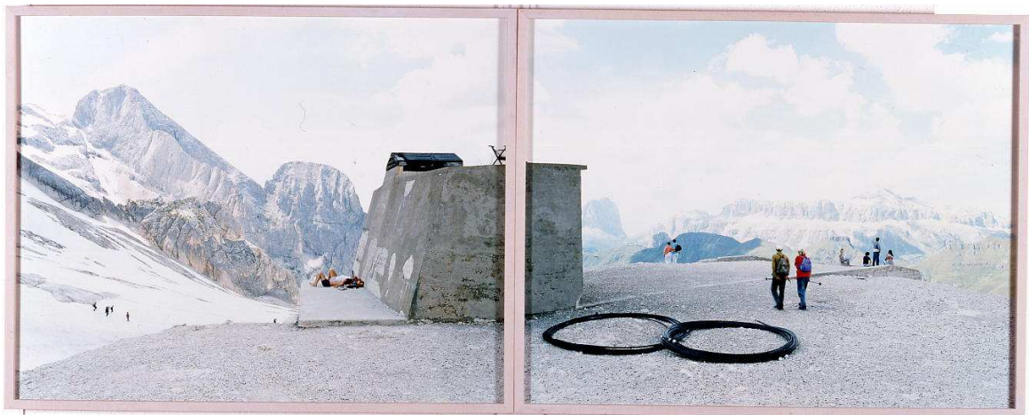
Walter Niedermayr, Pian dei Fiacconi III , 1994 diptyque, photographie couleur, 106 x 252 cm Collection FRAC Limousin

Chapelle Saint Libéral, Brive-La-Gaillarde vernissage le 23 mai 2002 à 18h30