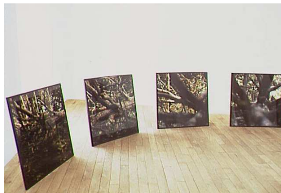
Seton Smith, Crashing Trees , 1990 Collection FRAC Limousin / © Seton Smith

* interview publiée dans le journal catalogue de l'exposition de Seton Smith chez Jule Kewenig, Cologne, (sept-nov 1991).