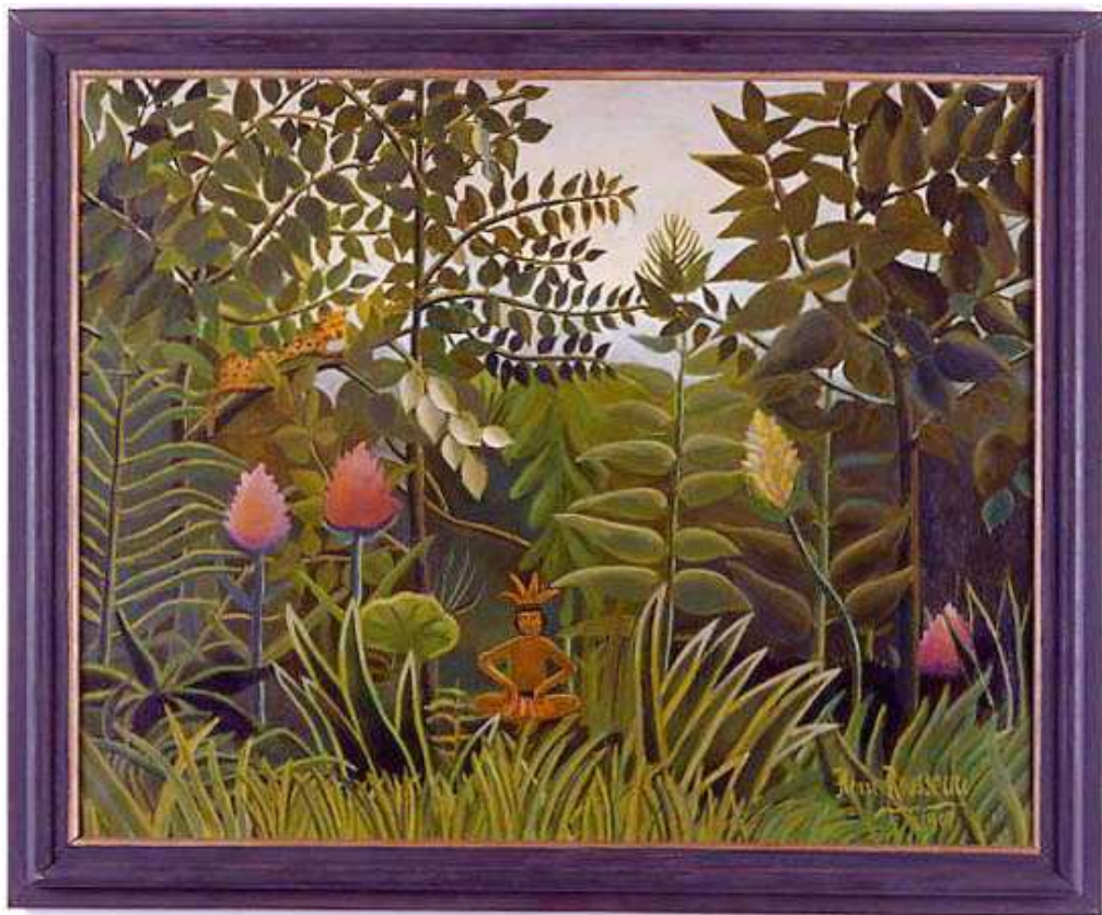
ERNEST T., Paysage exotique , 1993 peinture à l'huile / toile, 73 x 92 cm Collection FRAC Limousin

Chapelle Saint Libéral, Brive-La-Gaillarde du 23 mai au 23 juin 2002