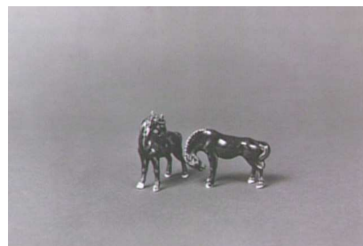
Joachim Mogarra, Les montagnes, les plaines, les mers, les fleuves, les arbres, les bêtes, les hommes , 1988 Collection FRAC Limousin